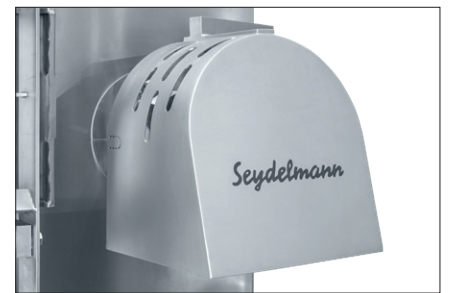
出料口保护装置 (可选)