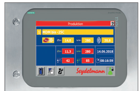
Command 700 W (optional bei frequenzgesteuertem AC-6 Hauptantrieb)