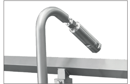
料位传感器 ( 选配 )