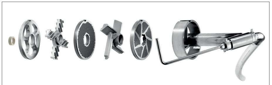
分离装置 ( 选配 )