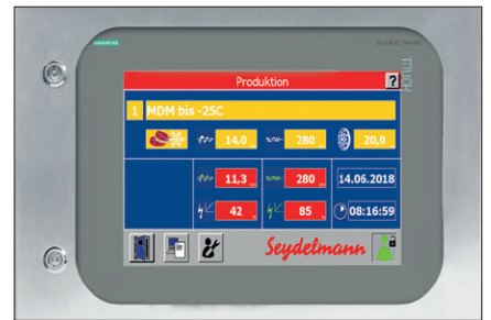
Command 700 W ( AC-6 无级变频驱动 )